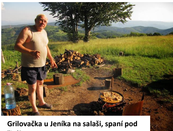
Grilovačka u Jeníka na salaši, spaní pod širákem